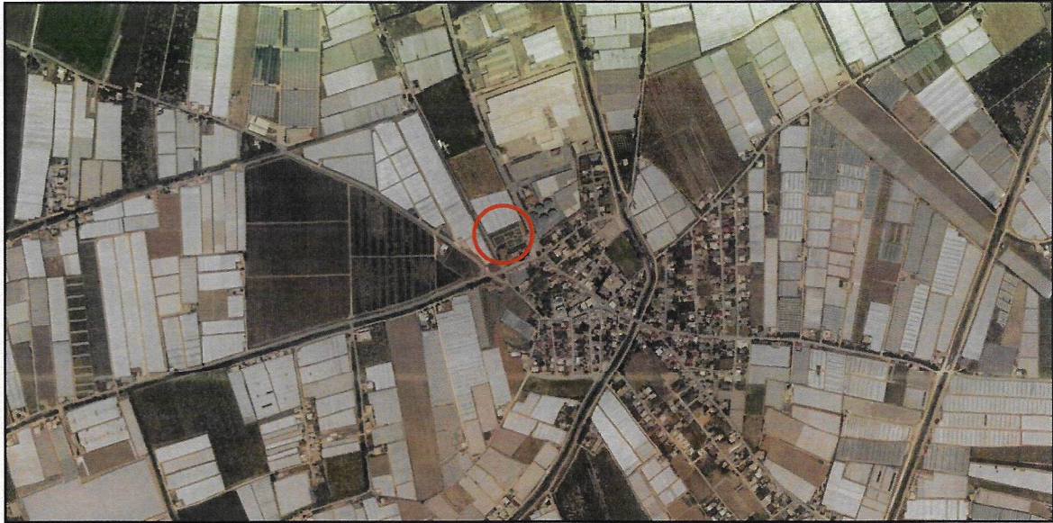
Harita 1: Plan Değişikliği Alanının Uydu Görüntüsü

Bahse konu plan değişikliği alanı Mersin İli Akdeniz İlçesi TKGM' de Homurlu Mahallesi sınırları içerisinde yer almaktadır. 1/1000 ölçekli hâlihazır haritalarda, O33B11C4D paftasında kalmaktadır.