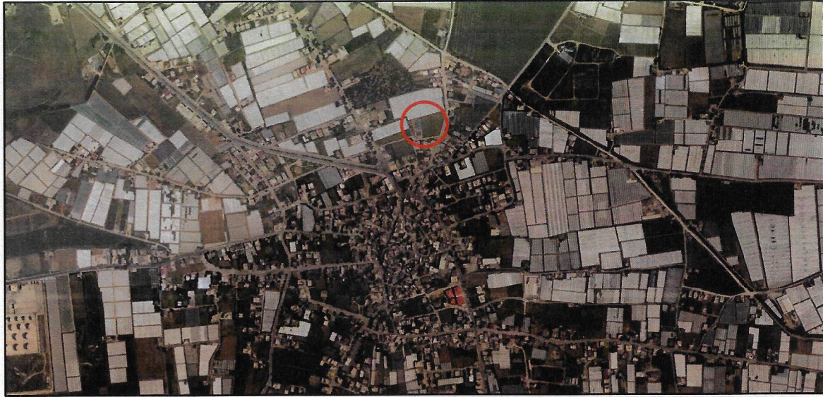
Harita 1: Plan Değişikliği Alanının Uydu Görüntüsü

Bahse konu plan değişikliği alanı Mersin İli Akdeniz İlçesi TKGM' de Kazanlı Mahallesi sınırları içerisinde yer almaktadır. 1/1000 ölçekli hâlihazır haritalarda, O33B16D1A paftasında kalmaktadır.