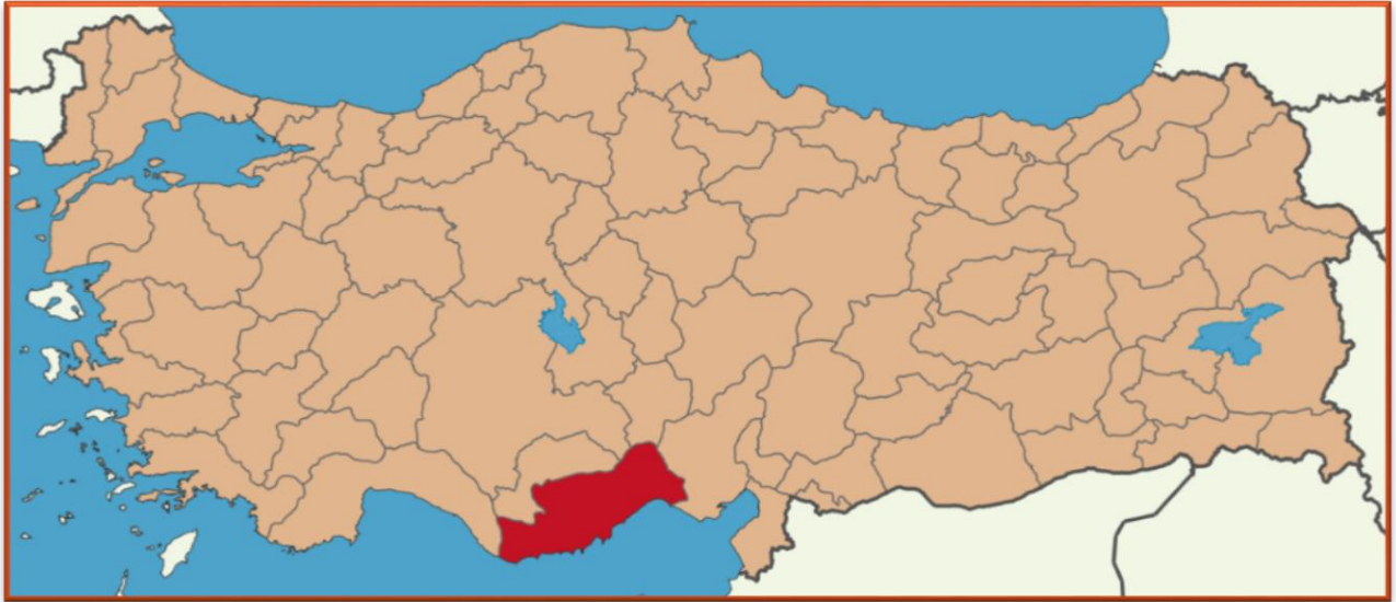
Harita 1: Mersin İlinin Ülke İçindeki Konumu

Mersin, eski adıyla İçel, Türkiye'nin bir ili ve en kalabalık onuncu şehridir. Türkiye'nin güneyinde bulunan ve Büyükşehir Belediyesi statüsüne sahip bir liman kentidir. Mersin ili 34° 47' 30'' kuzey enlemleri ile 34° 38' 00'' doğu boylamları arasında, Akdeniz Bölgesi'nin Çukurova Bölümü'nde yer almaktadır. Mersin'in batısında Antalya, kuzeybatısında Karaman, kuzeyinde Konya, kuzeydoğusunda Niğde ve doğusunda ise Adana illeri bulunmaktadır. Mersin ilinin kara sınırı 608 km, deniz sınırı 321 km olup, kıyı bandınının 108 km'si kumlu doğal plajlardan oluşmaktadır (2016 itibarıyla 1.773.852 nüfusa ve 16.010 km 2 yüzölçümüne sahiptir. 2018 yılında TÜİK verilerine göre 13 İlçe ve belediye, bu belediyelerde toplam 805 mahalle bulunmaktadır. Akdeniz,Anamur,Aydıncık,Bozyazı,Mezitli,Yenişehir,Silifke,Tarsus,Çamlıyayla,Erdemli,Gülnar ve Mut ve Toroslar Mersin'in ilçeleridir. Mersin ili Batı ve Orta Toros dağları üzerinde yer almaktadır. Denize paralel uzanan Orta Toros'lar Mersin'i İç Anadolu Bölgesi'nden ayırmaktadır. Burada yer alan Sertavul Geçidi ve Gülek Boğazı İç Anadolu'yu Mersin'e bağlayan önemli geçit noktalarındandır.