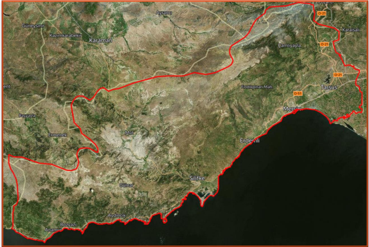
Şekil 1: Mersin İli Uydu Görüntüsü

Mersin yöresi, Coğrafi konumu, tarihi, turizmi, sosyal yapısı ile ülke genelinde önemli bir yerleşim bölgesidir. Akdeniz bölgesinde bulunması nedeniyle tropik Akdeniz ikliminin hüküm sürdüğü yörede, yılın büyük bölümü güneşli geçmekte, uzun yaz ve sonbahar aylarında denizden istifade edilebilmektedir. Sahil kesiminden kuzeye doğru çıkıldıkça kara iklimi görülmeye başlar. Bu durum ilde yaz aylarında önemli bir yayla turizminin doğmasına neden olmuştur. Yörede 20 30 km uzaklıkta denizden veya yayla olanaklarından faydalanmak, iki iklimi aynı gün bir arada yaşamak mümkündür. İlin 321 km. uzunluğundaki kıyı bandından 108 km.si kumlu doğal plajlardan oluşmaktadır.