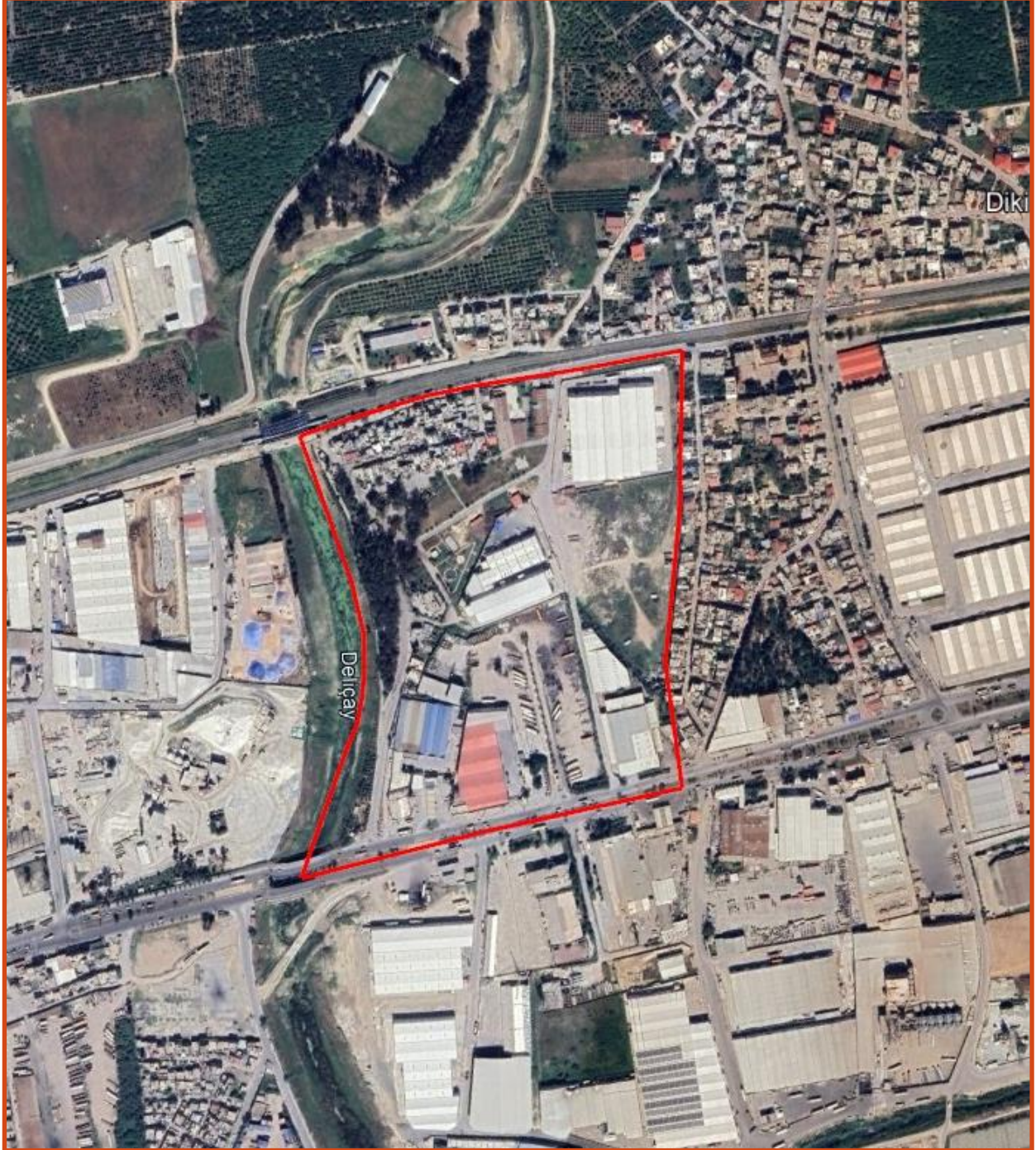
Şekil 3:Planlama Alanı Uydu Görüntüsü

Planlama alanı içerisinde konut, depolama, okul, resmi kurum, dini tesis, açık spor tesisi, konut dışı kentsel çalışma alanları, bakım servis ve akaryakıt istasyonu, park ve trafo alanları bulundurmaktadır.