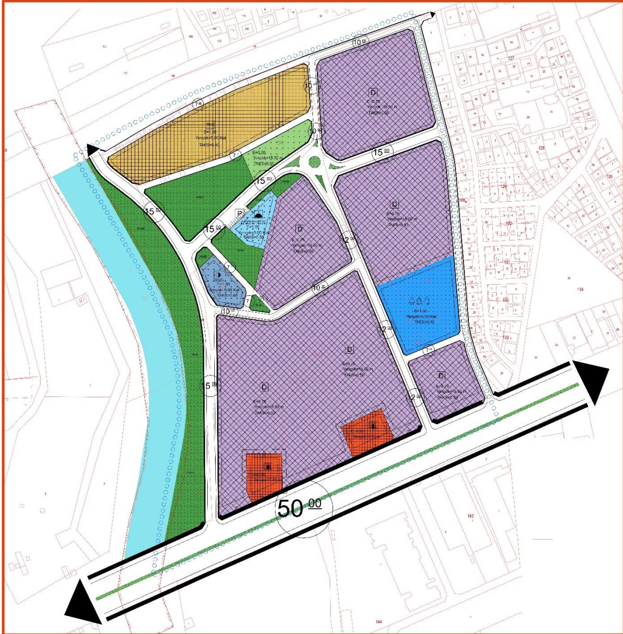
Şekil 6:1/1000 Ölçekli Revizyon Uygulama İmar Planı Teklif Plan

Yaklaşık 20.73ha alanı kapsayan “MERSİN İLİ AKDENİZ İLÇESİ KARACAILYAS EMEK MAHALLESİ 1/1000 ÖLÇEKLİ REVİZYON UYGULAMA İMAR PLANI”, plan hiyerarşisi gereği 1/5000 ölçekli “Akdeniz-Toroslar-Yenişehir-Mezitli İlçeleri II.Etap 2.Bölge 1/5000 Ölçekli İlave ve Revizyon Nazım İmar Planı” doğrultusunda ve Mersin Büyükşehir Belediyesi 12.12.2022 tarih ve 673 sayılı Akdeniz Kent Merkezi 1/5000 ölçekli Plan Değişikliği meclis kararı doğrultusunda onaylanmış ve üst ölçekli plan kararları 1/1000 Ölçekli Uygulama İmar Planı ölçeğinde işlenmiştir. Buna göre 1/1000 Ölçekli Revizyon Uygulama İmar Planı aşağıda sunulmuştur.