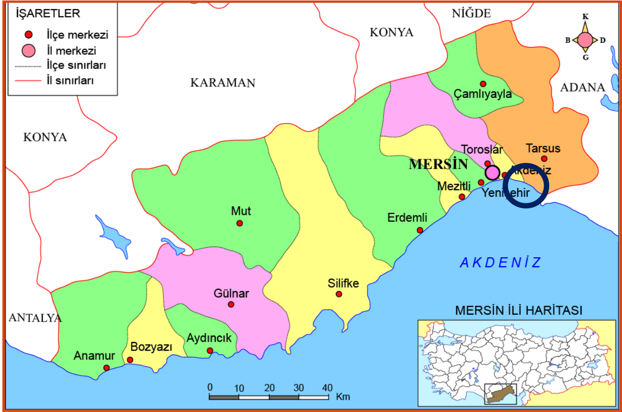
Harita 2: Akdeniz İlçesi'nin Mersin İli İçerisindeki Konumu

bölge olması, İç Anadolu, Doğu Anadolu ve Güney Doğu Anadolu Bölgeleriyle karayolu bağlantısı bulunması, hammadde kaynaklarına yakın olması ve iklim şartlarının yılın 12 ayında çalışmaya müsait olmasıdır (Çevre Durumu Raporu 2017).